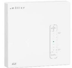
GS 41.11 knx

Das Gerät ist zur Verwendung für folgende Aufgaben vorgesehen: Überwachung der Luftgüte in der Gebäudesystemtechnik (Schule, Büro, Hotel, Tagungsstätte etc.), Datenübertragung und Regelung per Bus-System. Das Gerät ist für den Betrieb gemäß den aufgeführten technischen Daten geeignet. Das Gerät ist ausschließlich zum Einsatz in trockenen Räumen geeignet. Das Gerät ist nicht geeignet für sicherheitsrelevante Aufgaben, wie z.B. Fluchttüren, Brandschutzeinrichtungen, Gärkeller etc.