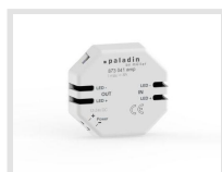
paladin 873 041 amp