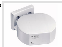
müller FU 3x.00 pro