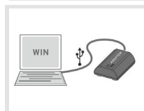
Software für PP50/PP60