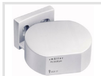
müller FU 20.00 pro