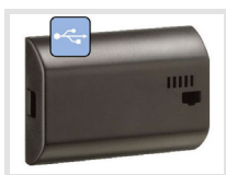
PP 50.00 pro