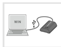
Software für PP50/PP60