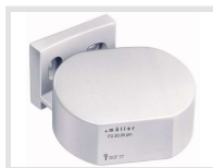
müller FU 20.00 pro