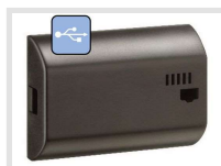
PP 50.00 pro