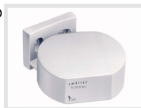
müller FU 3x.00 pro