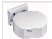
müller FU 20.00 pro