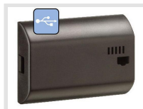
PP 50.00 pro