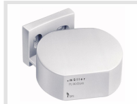
müller FU 3x.00 pro