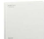
GS 40.00 mod / GS 30.00 mod / TS 30.00 mod