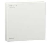
GS 40.00 mod / GS 30.00 mod / TS 30.00 mod