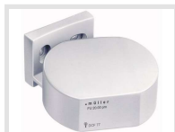
müller FU 20.00 pro