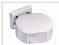
müller FU 3x.00 pro